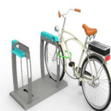
Station Juliette (Chargement manuel)