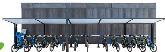
Station Mobile-Plug (Chargement automatique)