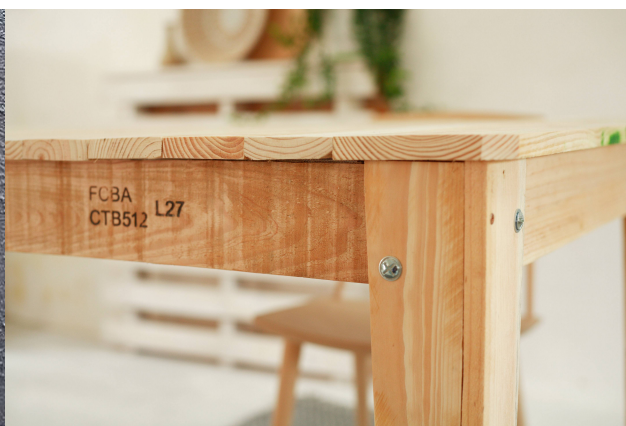
Table en bois de palettes