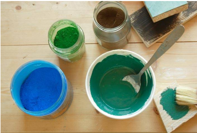
Atelier Peintures et Pigments

Les ateliers proposés à LA MAISON JARDIN iront des produits cosmétiques au ménage au naturel en passant par les patines écologiques ou bien encore les décorations de Noël, les tapis en tissu recyclé, les luminaires en pulpe de papier, les petits meubles en bois de palettes. Ils prôneront le fait main, les matières naturelles, la créativité sous toutes ses formes.