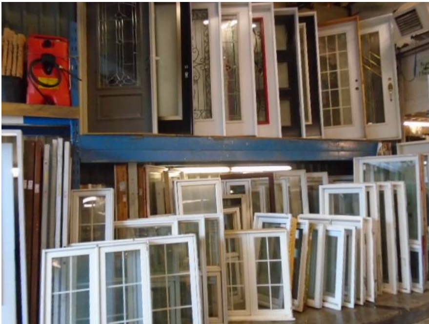
Quebec Aubaines Recycle

Le BTP, la construction et la rénovation génère 40 % des déchets produit en France. Nous n'avons pas (encore !) de réseaux de seconde main, comme cela existe au Québec par exemple, qui permettent d'acquérir différents matériaux de déconstruction. C'est un non sens, un gâchis.