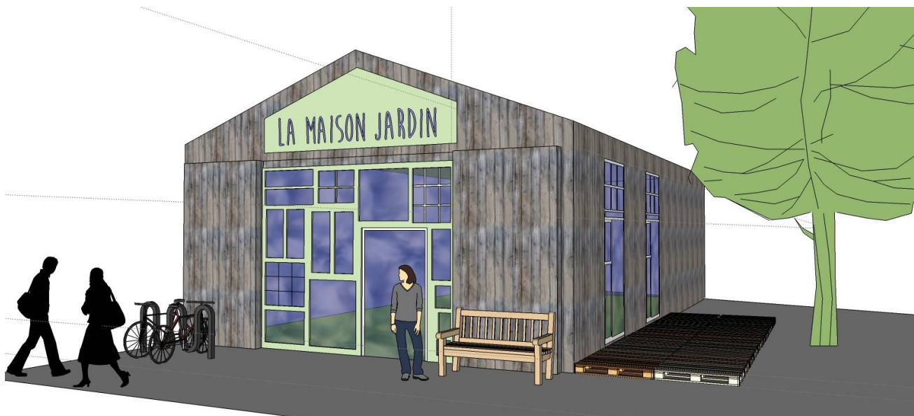
Exemple d'aménagement hangar urbain – N.Boisseau