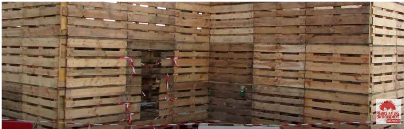
Murs à base de palettes, système de l'entreprise Sofrinov

transformé en vaste serre - sera l'occasion de tester de multiples techniques et mises en oeuvres Low Tech (simples, écologiques, économiques et facilement reproductibles) à base de matériaux naturels et/ou recyclés.