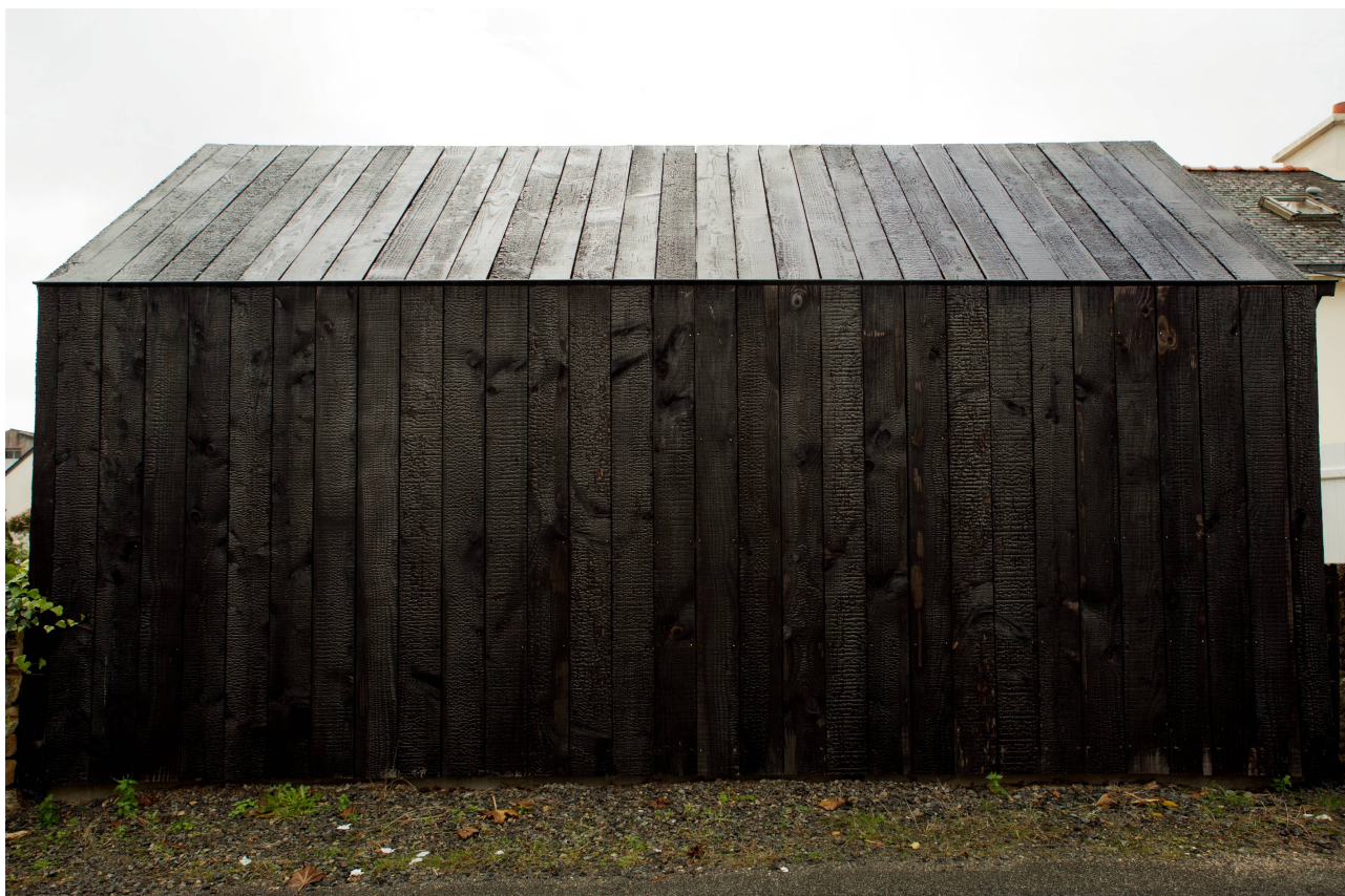
Maison couverte et bardée en bois brûlé région Nantaise © NeM Architectes