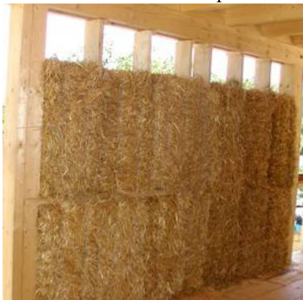
Mur isolé en paille – Technique GREB

Chaque chantier ou atelier Low Tech sera encadré par un spécialiste de la technique, que ce soit une association, un collectif, une personne ayant déjà été formée, un artisan, un professionnel, un passionné.